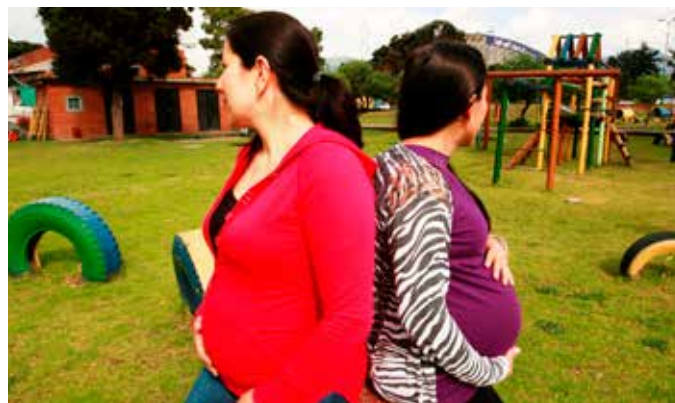
Campañas de prevención del embarazo adolescente son más efectivas cuando incluyen a jóvenes.

Sin embargo, pese a los alentadores resultados de la ENDS 2015, sigue siendo preocupante las diferencias que se ven a nivel educativo. Al momento de la última