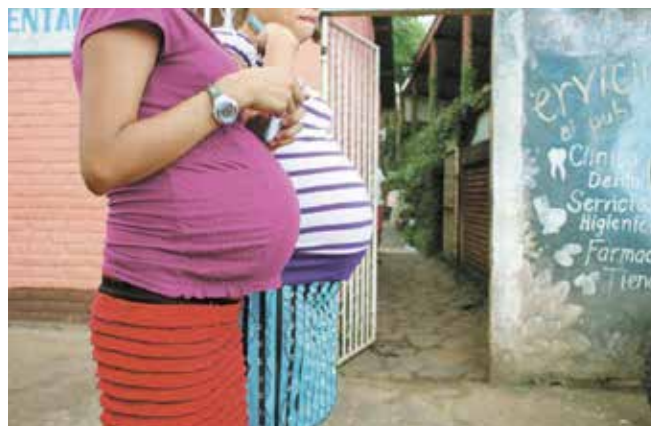
Honduras es el segundo país, después de Bolivia, con mayor tasa de embarazos adolescentes en América Latina.